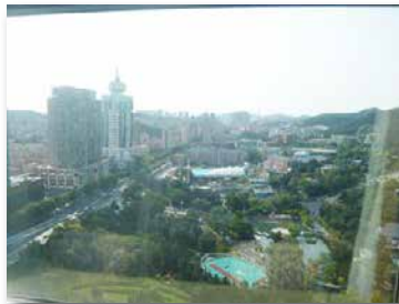
スイスホテルからの景色