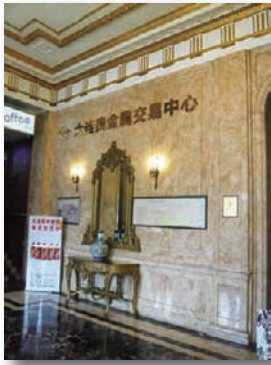
旧 ヤマトホテルロビー