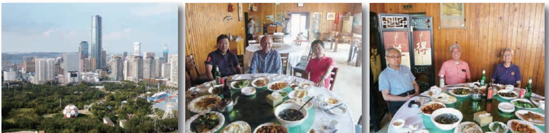
大連 TV 塔