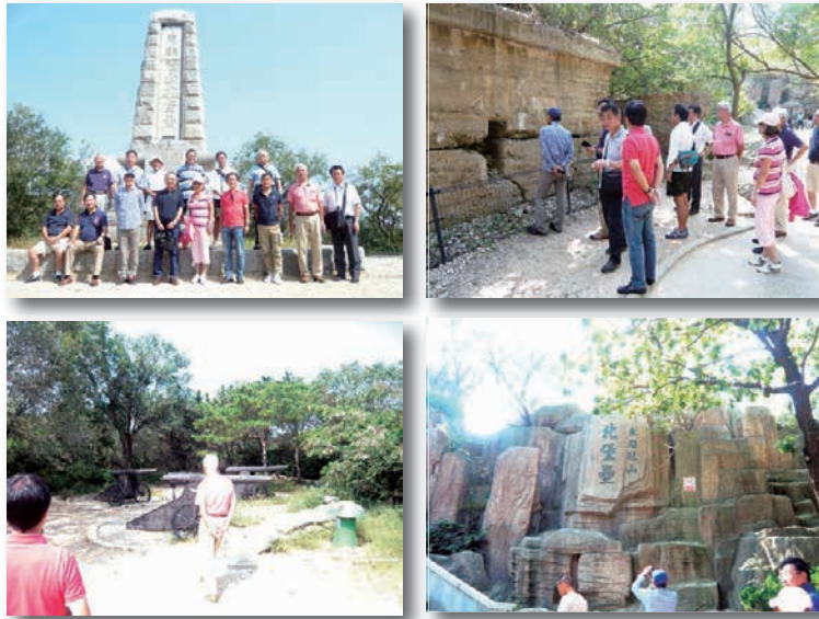
ロシア要塞、東鶏冠山