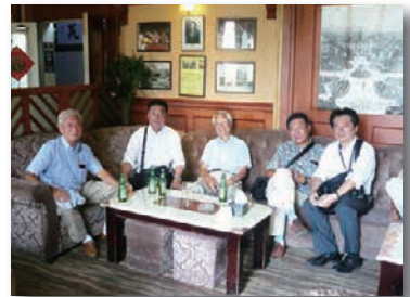
ヤマトホテル ティーサロンで休憩