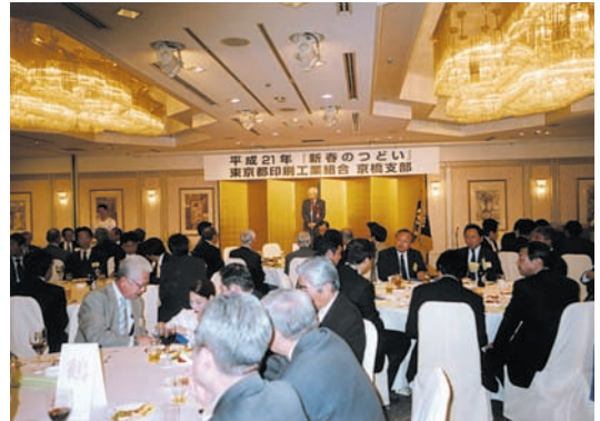
矢田中央区長挨拶