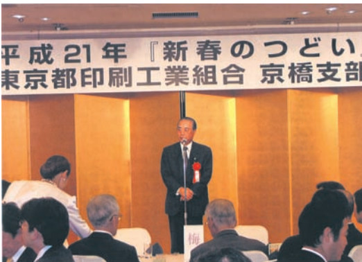
関連業界代表挨拶