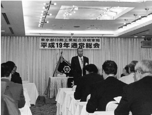
神田副支部長 開会の挨拶