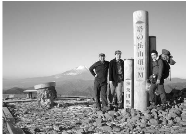
忘年登山 丹沢・塔の岳