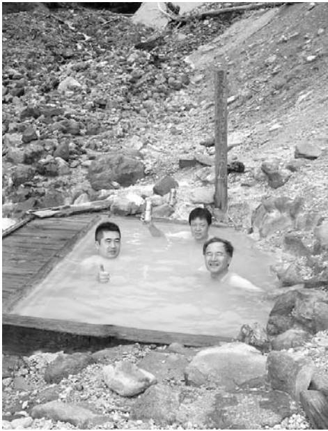
本沢温泉 雲上の湯