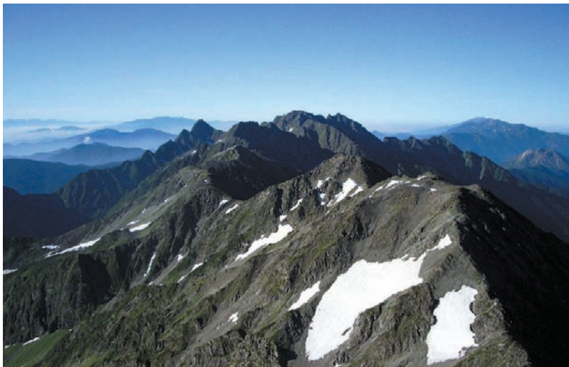
槍山頂より奥穂高方向を望む