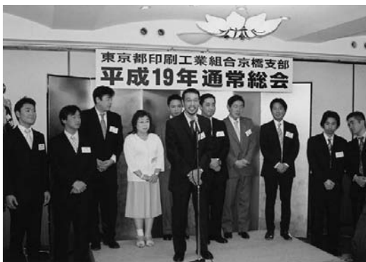
京青会会員の紹介