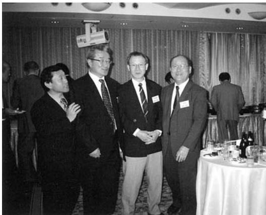
なごやかに懇親会が進みました